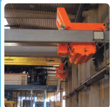
Drehkübel und Betonverteiler 3.000 l