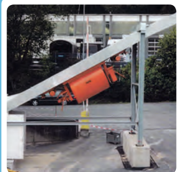
Drehkübel 3.500 l in Steigung 32° = 60%