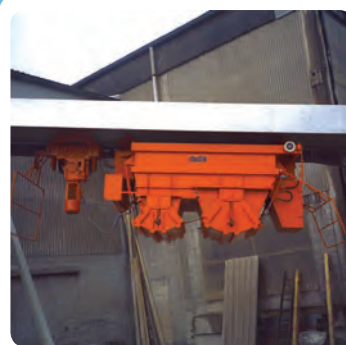
Doppelkammerkübel 3.000 / 1.500 l