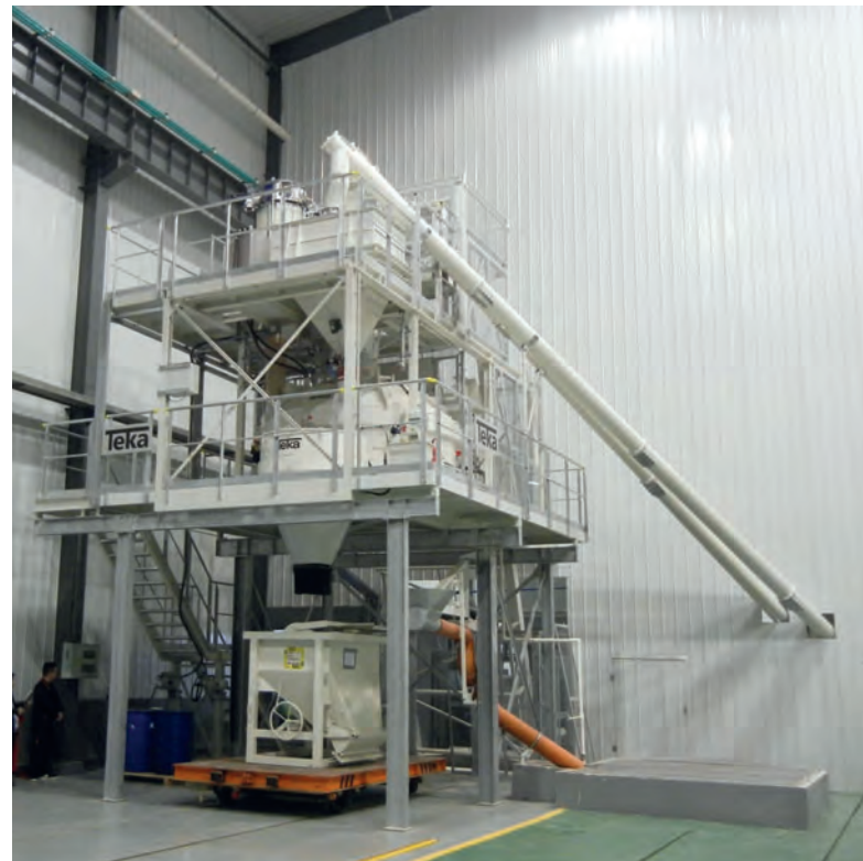
Betonmischanlage von Teka