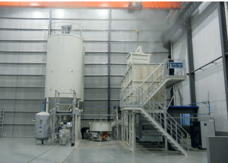
Reihensilos und Zementsilos