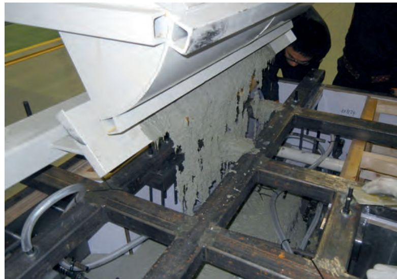
Betonieren des ersten Bauteils