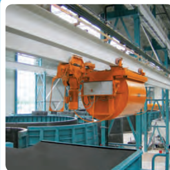
Drehkübel 4.500 l